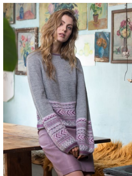
Prøv genseren i lys grå | DSA77-16