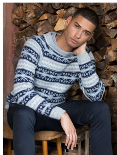
Prøv genseren i blå | DSA77-04