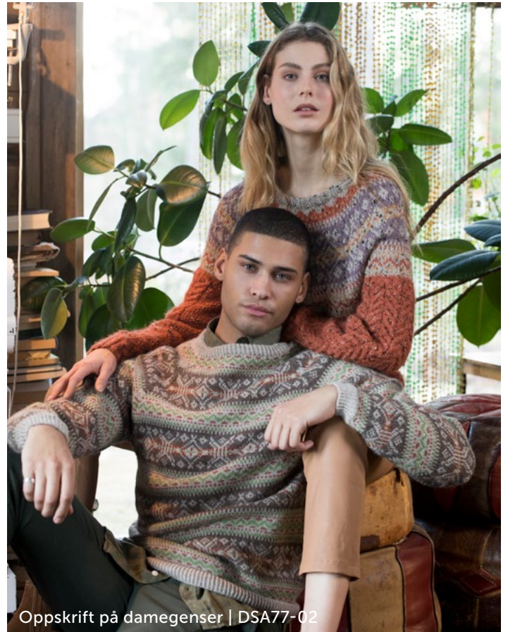
Oppskrift på damegenser | DSA77-02

Sy sammen under ermene. Brett halskanten dobbel mot vrangen og sy til med løse sting.