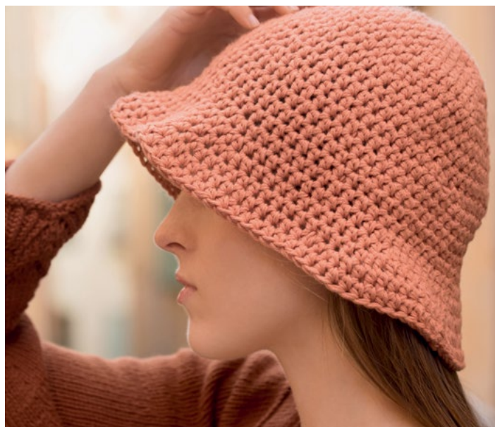
Prøv bøtتهatten i mandarin | DSA 67-19